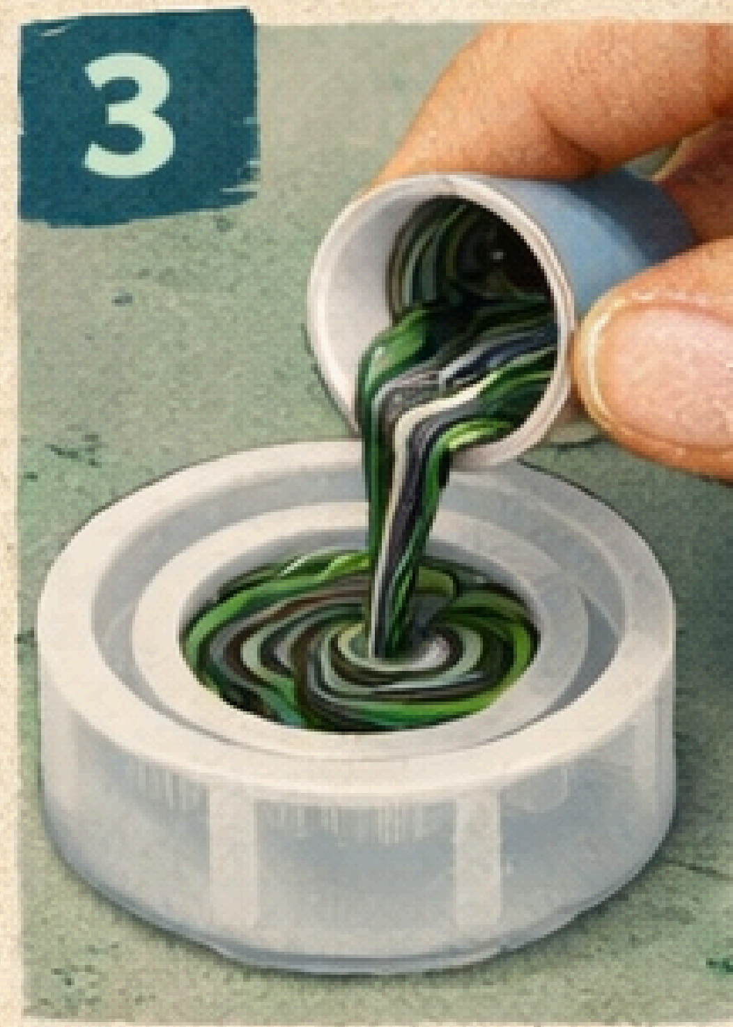
3 Mezcla y Vierte en Molde