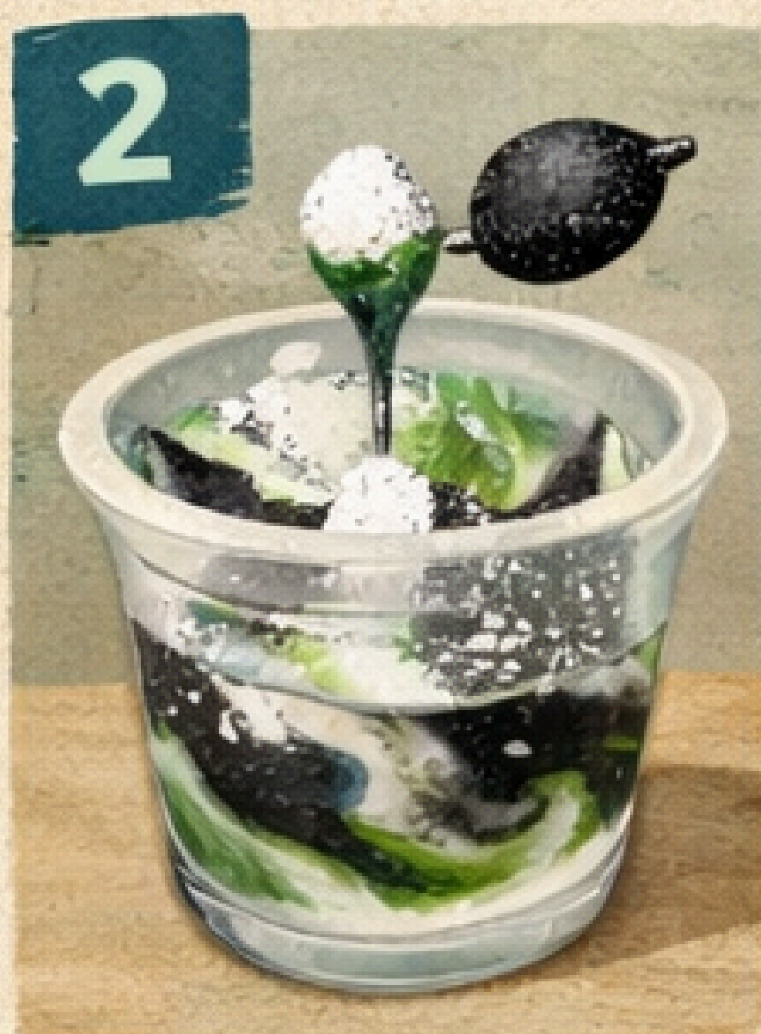
2 Añade Pigmentos