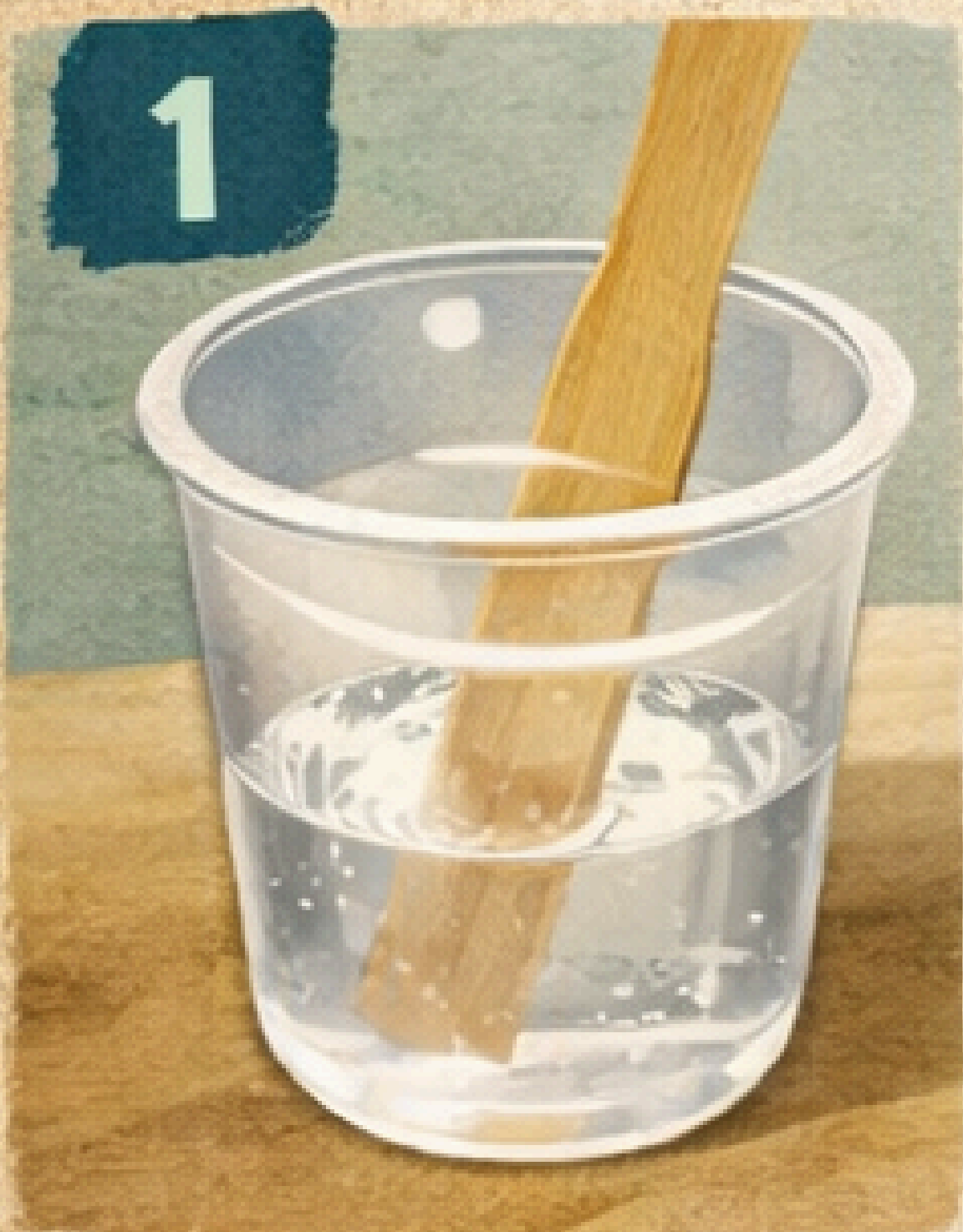
1 Mezcla Resina