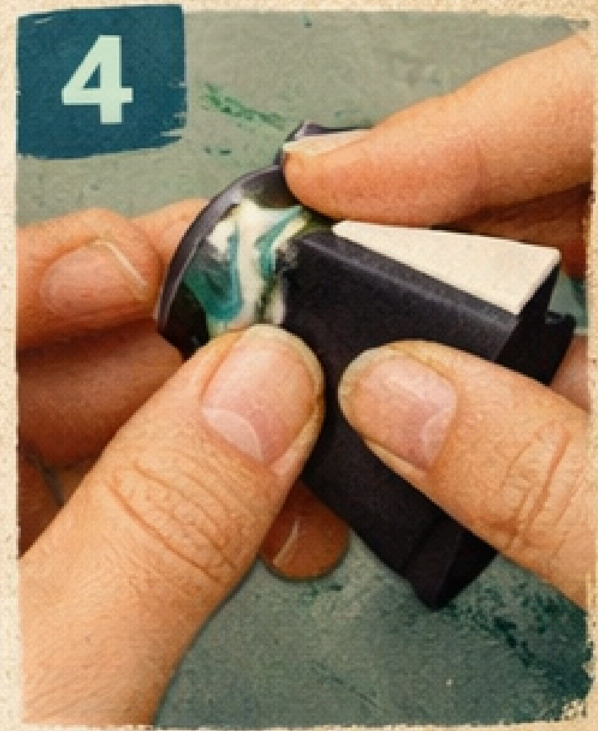
4 Lija y Pule el Anillo